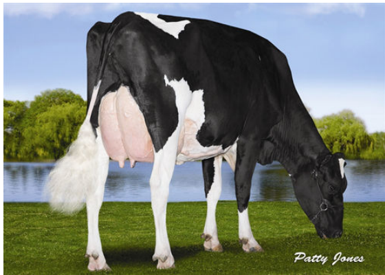
RANSOM-RAIL FACEBK PARIS FOURTH DAM