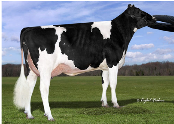
SIEMERS DENVER PARIS GRANDDAM